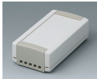
B1040465 TOPTEC 102, исп. II АБС (UL 94 HB) белый RAL 9002 102x54x30mm IP 40