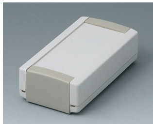
B1040365 TOPTEC 102, исп. I АБС (UL 94 HB) белый RAL 9002 102x54x30mm IP 40