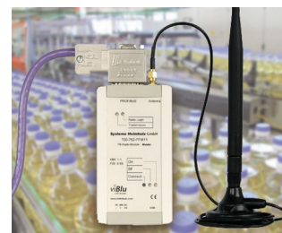
PROFIBUS radio system