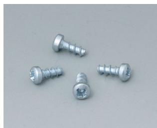
A9199008 Набор шурупов