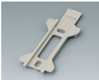
B1350028 Настенный держатель для TOPTEC 123 ПК+АБС (UL 94 V-0) тепло-серый RAL 7032