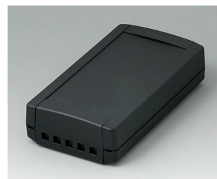
B1065469 TOPTEC 154 F, исп. II АБС (UL 94 HB) черный RAL 9005 154x84x38mm IP 40