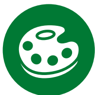
Отливка из нестандартных материалов