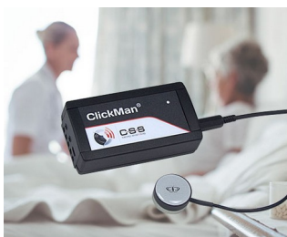
Adaptive multicontroller for single sensors

Универсальные корпуса для электронных и электротехнических приборов. Мониторинг, системы оповещения и управления. Медицинская и оздоровительная техника. Лабораторные приборы. Компьютерная периферия. IoT/IIoT.