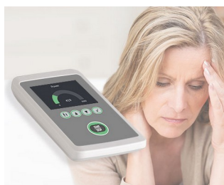
Biofeedback to reduce stress

Идеально подходят для мобильных электронных устройств, как внутри помещений, так и снаружи. Контрольно-измерительная аппаратура. Беспроводная связь. (Промышленный) интернет вещей. Медицинская и лабораторная техника. Оборудование спортивных и косметических центров. Офисная техника. Системы безопасности. Технологии защиты окружающей среды.