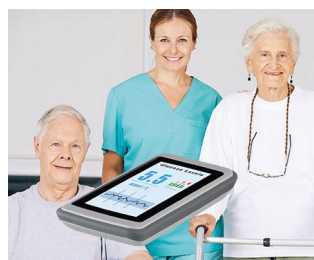
Sensor Checkup System / Monitoring