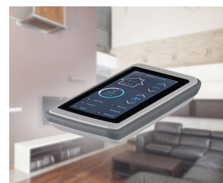
Smart Home Control