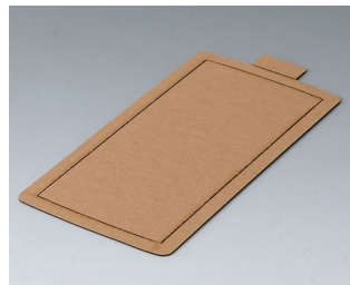
B5503300 Самоклеящаяся плёнка М