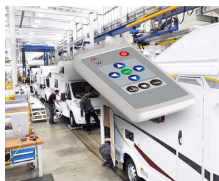
Remote control for interior design