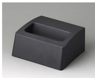
A9105508 База S ACA+ПК (UL 94 V-0) лава