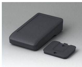
A9005208 DATEC-COMPACT S АСА+ПК (UL 94 V-0) лава 136x74x32mm IP 65