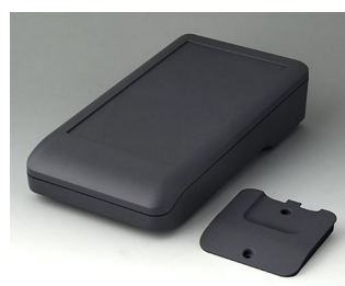
A9007218 DATEC-COMPACT L ACA+ПК (UL 94 V-0) лава 206x110x47mm IP 41