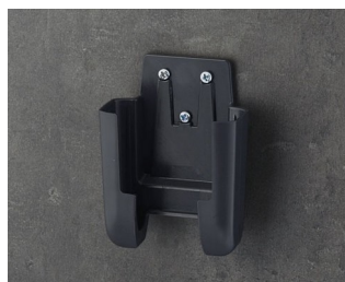
A9105628 Настенный держатель S АСА+ПК (UL 94 V-0) лава