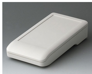
A9006117 DATEC-COMPACT M АСА+ПК (UL 94 V-0) белый RAL 9002 172x92x39mm IP 41