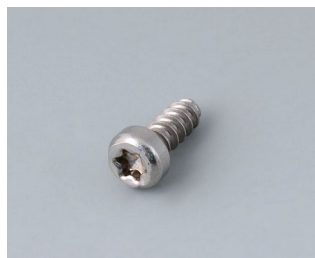
A0325060 Шуруп 2,5 x 6 мм (T8) нержавеющая сталь