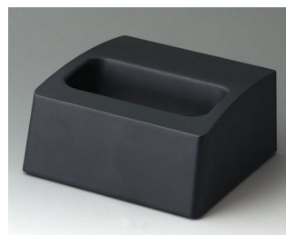
A9106508 База M ACA+ПК (UL 94 V-0) лава