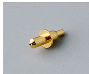
A9193031 Пружинный контакт позолоченный