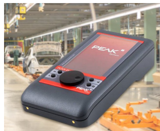
Mobile diagnostic device for CAN and CAN FD buses