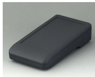
A9006118 DATEC-COMPACT M АСА+ПК (UL 94 V-0) лава 172x92x39mm IP 41