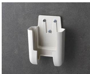
A9105627 Настенный держатель S АСА+ПК (UL 94 V-0) белый RAL 9002