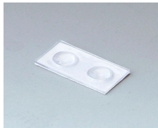
A9207150 Резиновые ножки 6,5 x 2 мм прозрачный

Возможно внесение изменений без предварительного уведомления. © by OKW Gehäusesysteme, Buchen/Germany.