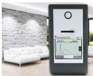
Spectral light meter