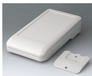
A9007217 DATEC-COMPACT L ACA+ПК (UL 94 V-0) белый RAL 9002 206x110x47mm IP 41