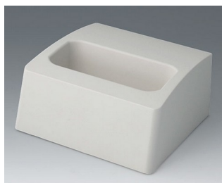
A9107507 База L АСА+ПК (UL 94 V-0) белый RAL 9002