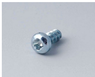
A0305031 Шуруп 2,5 x 6 мм (PZ1)