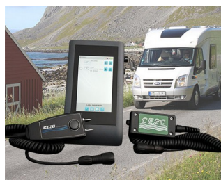
System for leak detection in leisure vehicles