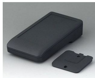
A9006218 DATEC-COMPACT M АСА+ПК (UL 94 V-0) лава 172x92x39mm IP 41