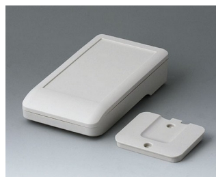
A9005217 DATEC-COMPACT S АСА+ПК (UL 94 V-0) белый RAL 9002 136x74x32mm IP 41