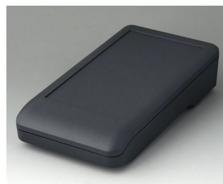
A9007118 DATEC-COMPACT L ACA+ПК (UL 94 V-0) лава 206x110x47mm IP 41