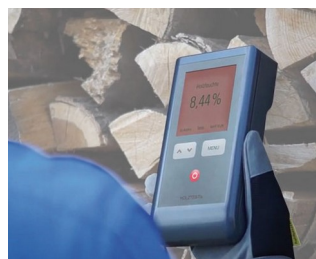
Wood moisture measuring device