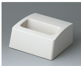
A9105507 База S ACA+ПК (UL 94 V-0) белый RAL 9002