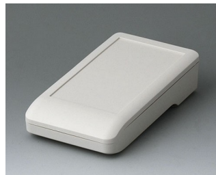
A9005117 DATEC-COMPACT S АСА+ПК (UL 94 V-0) белый RAL 9002 136x74x32mm IP 41