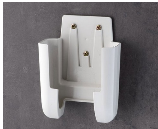
A9107627 Настенный держатель L АСА+ПК (UL 94 V-0) белый RAL 9002