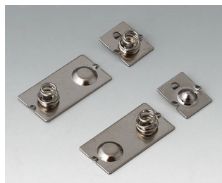
A9190024 Набор батарейных контактов, 3 x AAA Сталь никелированный