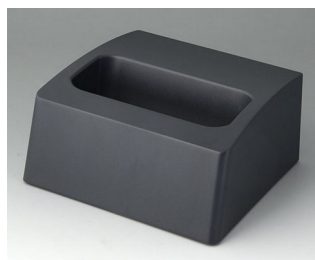
A9107508 База L АСА+ПК (UL 94 V-0) лава