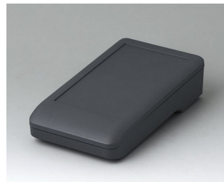
A9005118 DATEC-COMPACT S АСА+ПК (UL 94 V-0) лава 136x74x32mm IP 41