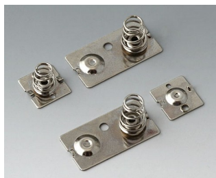
A9190023 Набор батарейных контактов, 3 x AA Сталь никелированный