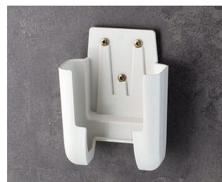
A9106627 Настенный держатель M АСА+ПК (UL 94 V-0) белый RAL 9002