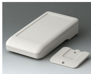
A9006217 DATEC-COMPACT M АСА+ПК (UL 94 V-0) белый RAL 9002 172x92x39mm IP 41