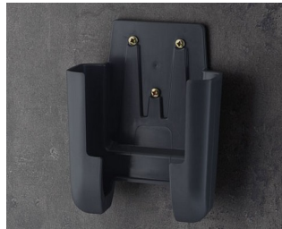
A9107628 Настенный держатель L АСА+ПК (UL 94 V-0) лава