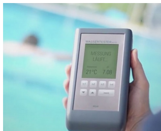
Electronic pool tester

Мобильный сбор данных. Контрольно-измерительная аппаратура. Пульты управления. Медицинская и лабораторная техника. Экоприборы. Применения вне помещений. Industry 4.0. «Умное» производство.