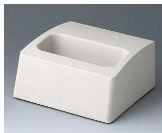
A9106507 База M ACA+ПК (UL 94 V-0) белый RAL 9002