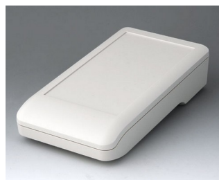
A9007117 DATEC-COMPACT L ACA+ПК (UL 94 V-0) белый RAL 9002 206x110x47mm IP 41