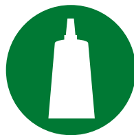
Установка / Сборка аксессуаров