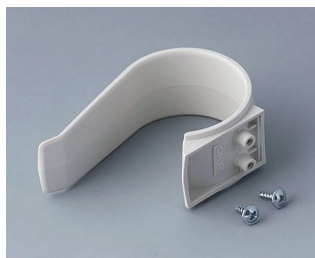
A9167027 Клипса-держатель ПА 6 (UL 94 HB) белый RAL 9002