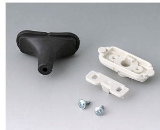
B2911309 Набор для ввода кабеля, 3,4 - 4,2 ТРЕ черный RAL 9005