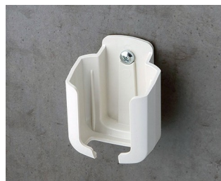
B2921507 Настенный держатель S АСА+ПК (UL 94 V-0) белый RAL 9002