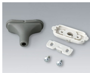
B2911328 Набор для ввода кабеля, 5,0 - 5,9 ТРЕ вулкан