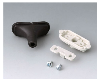
B2911329 Набор для ввода кабеля, 5,0 - 5,9 ТРЕ черный RAL 9005