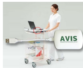
Receiver and data transfer for EMR