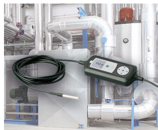
Process monitoring with temperature sensor