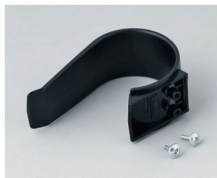
A9167029 Клипса-держатель ПА 6 (UL 94 HB) черный RAL 9005