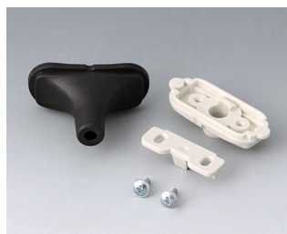
B2911319 Набор для ввода кабеля, 4,2 - 5,0 ТРЕ черный RAL 9005