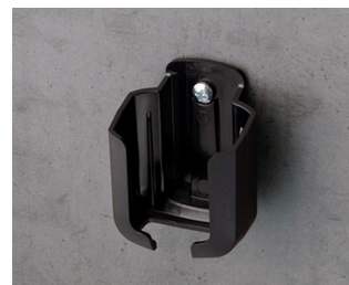
B2921509 Настенный держатель S АСА+ПК (UL 94 V-0) черный RAL 9005